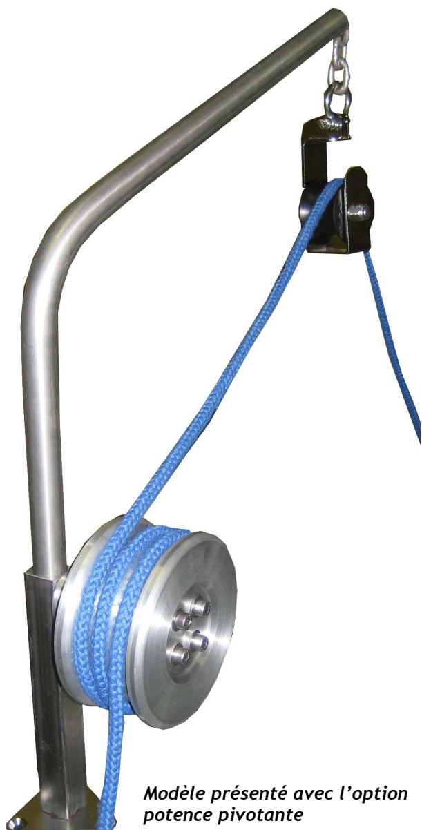
Modèle présenté avec l'option potence pivotante